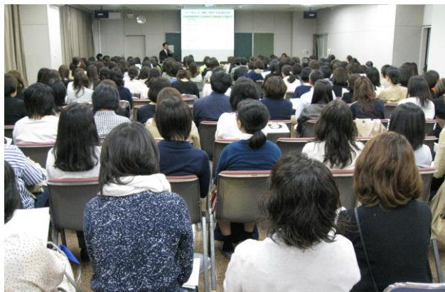
＜2年保護者会の様子＞