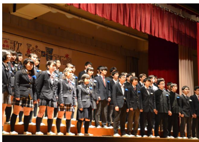
<審査員特別賞>1年C組「花束を君に」