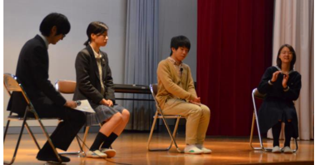
第3回学校説明会「ミニ座談会」