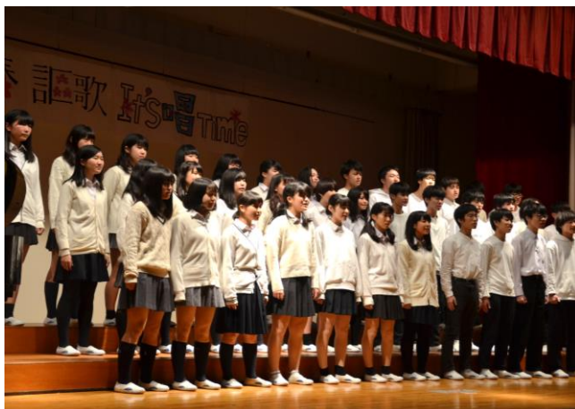
<準優勝>2年E組「アイネクライネ」