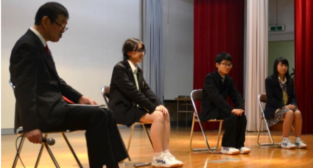
第2回学校説明会「ミニ座談会」

今年の学校説明会では、新たな企画として生徒による「ミニ座談会」を実施しました。竹早高校に決めた理由、竹早高校での生活の感想、将来の希望などについて語ってもらい、最後に高校受検に臨む際の心構えについて語ってもらいました。来場者のアンケートには「在校生の座談会を聞き、私もまだあきらめずに頑張ろうと強く思えた。」「とても感じのいい生徒さんたちで、うちの子も仲間入りできたら嬉しいなと思いました。」といった記述がありました。出演してくれた生徒の皆さん、本当にありがとうございました。