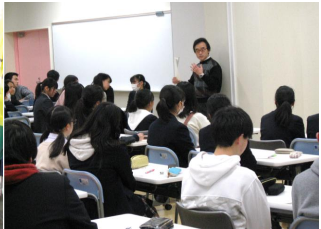
＜満席の生徒に熱く語る若杉先生＞