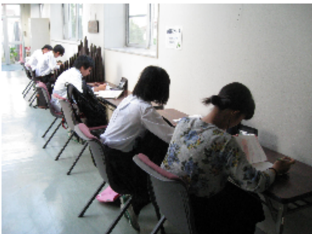
〈渡り廊下に新設された自習スペース〉