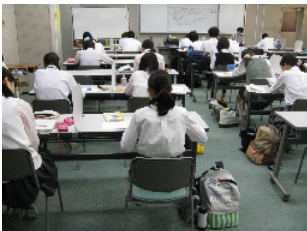
〈ほぼ満席となった従来の自習室〉