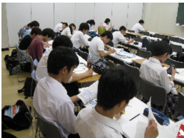
〈自習する生徒で一杯の地下教室〉

勉強している生徒の姿が校内の至るところで見られるようになれば、他の生徒たちも刺激を受けてますます自学自習が盛んになります。そういう好循環を起こすことにより皆が切磋琢磨して前向きに取り組む雰囲気定着させたいと思います。