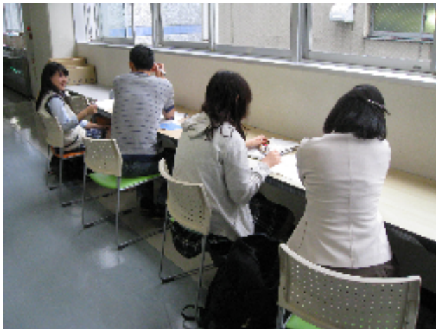
〈先生に個別で質問する生徒たち〉